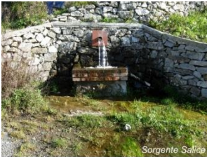
Figura 1- Sorgente Salice

Questa fontana con abbeveratoio si trova alla fine paese e, come è possibile osservare, dava da bere sia alle persone che agli animali. Chi scendeva in paese insieme alle bestie si riforniva qui, mentre chi saliva andava incontrando le sorgenti di montagna: la Sorgente Salice, l'Acqua don Petru e la Sorgente Rummulo, con acque limpide e di ottima qualità.