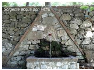
Figura 2- Sorgente Acqua Don Petru