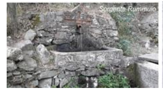
Figura 3- Sorgente Rummulo

Mandanici ha ancora molte altre fontane di nessuna rilevanza artistica o storica, ma dato che "Ogni acqua leva a siti" (ogni acqua fa passare la sete, detto che figuratamente afferma che, in caso di bisogno, qualsiasi cosa va bene) gli abitanti le hanno sempre conservate tutte al meglio. Gli annuali statistici del 1897 citano alcune sorgenti minerali come quella della Contrada Scoppo delle Balle, la Praga, la Fredda di Maurè e la Chirica, la migliore tra tutte per il suo potere digestivo.